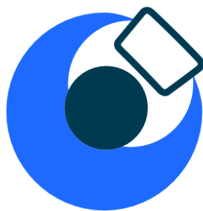
Nye farger, små tilpasninger